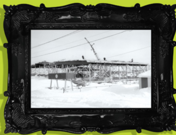
1 CHABOT, Denys, La politique culturelle de la Ville de Val-d'Or, 1997 , page 11.

Mais c'est au courant des années 60 et 70 que l'expression artistique connaît sa première véritable explosion, avec l'entrée dans l'âge adulte des baby-boomers, génération fort nombreuse formée d'hommes et de femmes pour la plupart nés à Val-d'Or. Les boîtes de nuit et autres locaux de jeunes se multiplient : on peut y entendre des chansonniers et des groupes rock, y voir du théâtre, y apprécier le talent de peintres, y écouter de la poésie... En 1964 est fondé le Conservatoire de musique de Val-d'Or, où on polira soigneusement le talent de dizaines de musiciens au fil des ans.